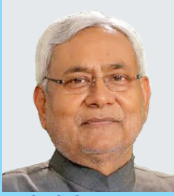
श्री नीतीश कुमार मुख्यमंत्री, बिहार